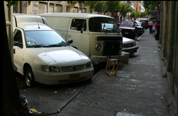
CALLES ANTES DE LA REHABILITACIÓN