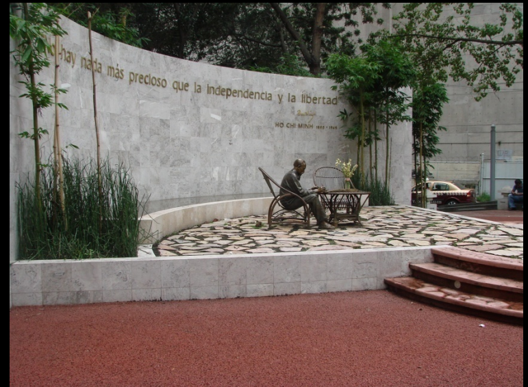
CONSTRUCCIÓN DEL JARDÍN VIETNAMITA