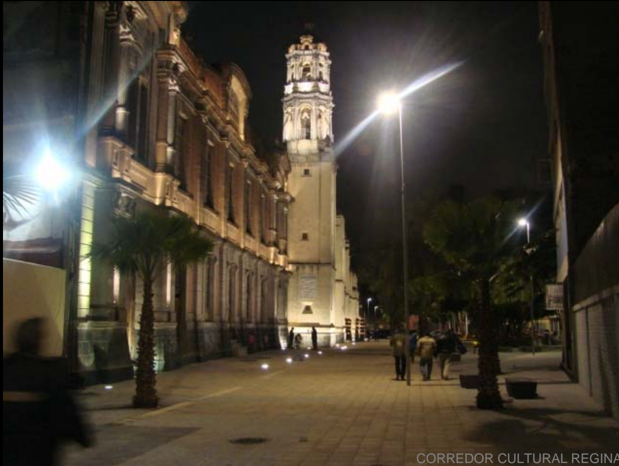
CORREDOR CULTURAL REGINA