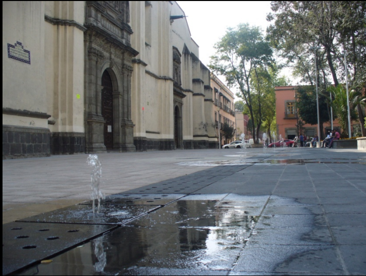
FUENTE SECA EN LA PLAZA REGINA COELI