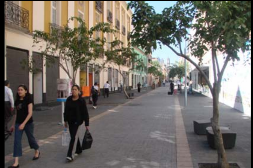
ANTES Y DESPUÉS CORREDOR CULTURAL REGINA