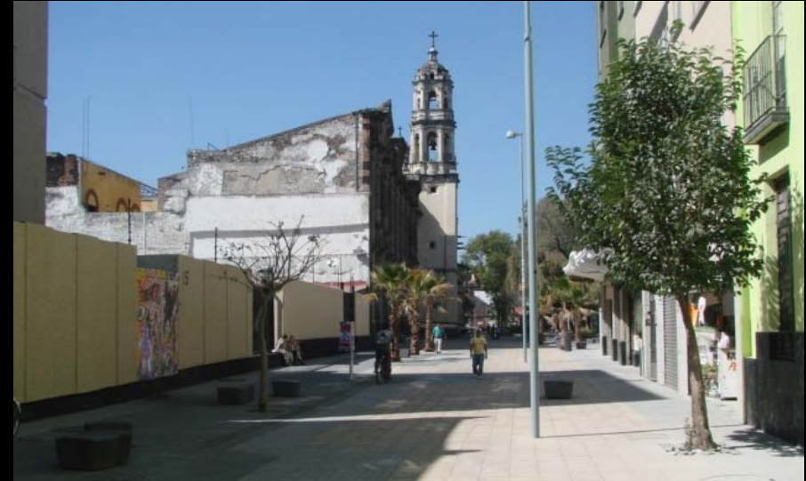
ANTES Y DESPUÉS CORREDOR CULTURAL REGINA