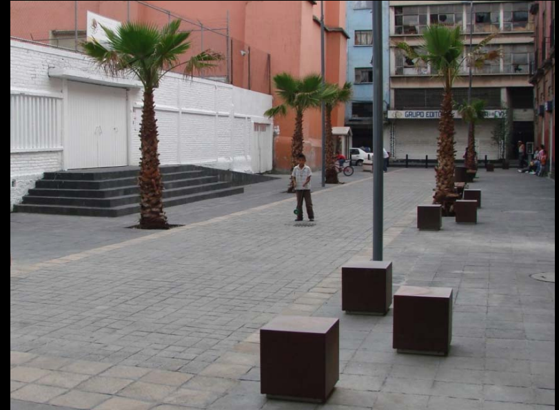
SEGUNDO CALLEJÓN DE MESONES