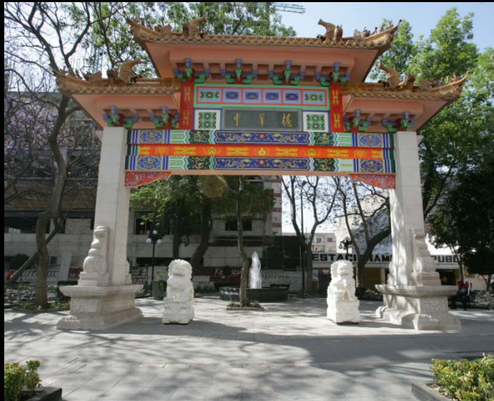
INSTALACIÓN DEL ARCO CHINO