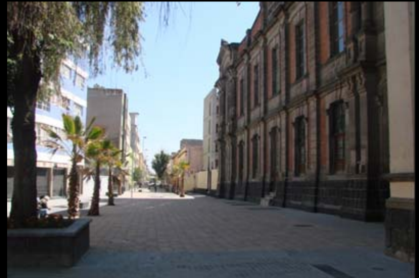
ANTES Y DESPUÉS CORREDOR CULTURAL REGINA