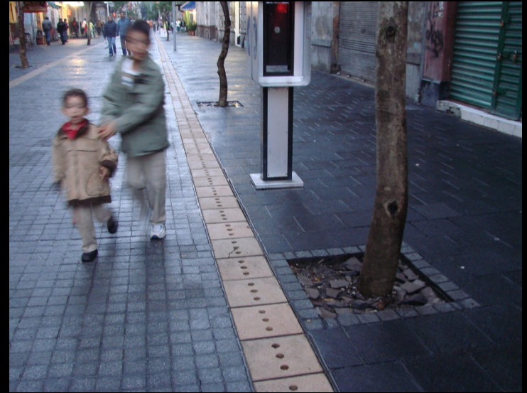
PREFERENCIA PEATONAL EN LOS CORREDORES CULTURALES